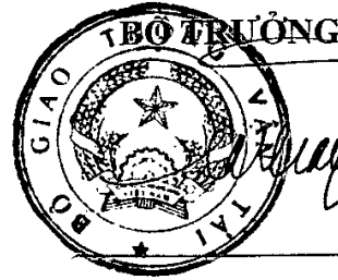
Đinh La Thăng