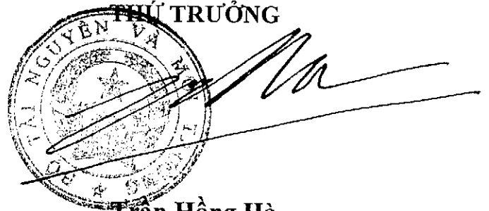
Trần Hồng Hà