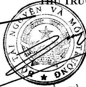
Trần Hồng Hà

KT. BỘ TRƯỞNG BỘ TÀI NGUYÊN VÀ MÔI TRƯỜNG THỦ TRƯỞNG